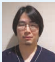
眼科 有蘭 生吹 医師