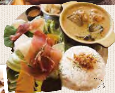
ほろほろチキンの茄子のやみつぎグリーンカレー