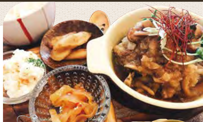
おろし和風ハンバーグ